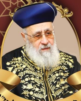
הרב יצחק יוסף שליט"א